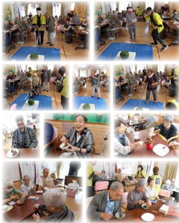
これらの行事は、ケアプランの一環として実施されております